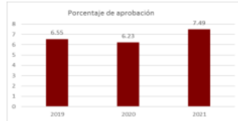
Gráfica 4.- Histórico de Reprobación