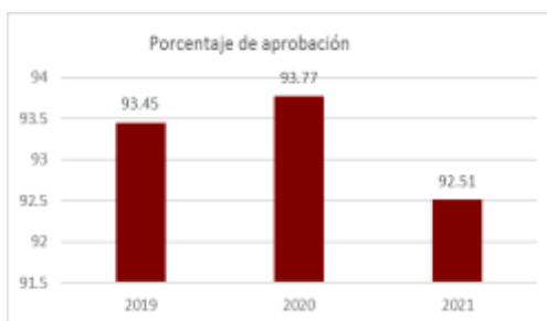
Gráfica 3.- Histórico de Aprobación