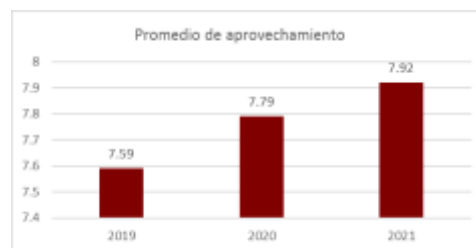
Gráfica 2.- Histórico de Aprovechamiento